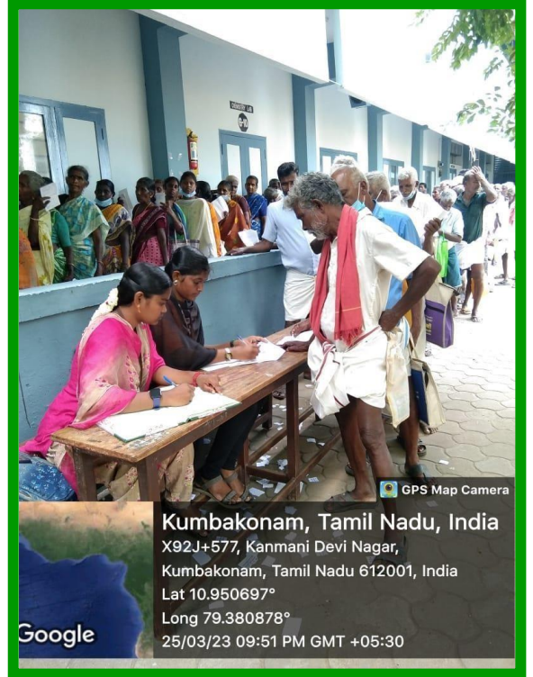
GPS Map Camera

Kumbakonam, Tamil Nadu, India X92J+577, Kanmani Devi Nagar, Kumbakonam, Tamil Nadu 612001, India Lat 10.950697° Long 79.380878° 25/03/23 09:51 PM GMT +05:30