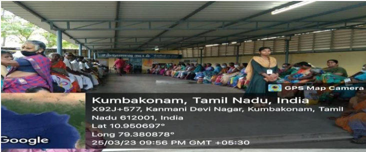
GPS Map Camera

Kumbakonam, Tamil Nadu, India X92J+577, Kanmani Devi Nagar, Kumbakonam, Tamil Nadu 612001, India Lat 10.950697° Long 79.380878° 25/03/23 09:51 PM GMT +05:30