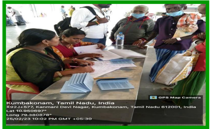
Kumbakonam, Tamil Nadu, India X92J+677, Kanmani Devi Nagar, Kumbakonam, Tamil Nadu 612001, India Lat 10.950897° Long 79.380878° 25/02/23 10:02 PM GMT +05:30